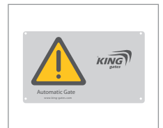
Tabliczka znamionowa Tab