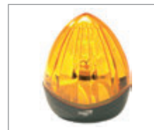
Lampa sygnalizacyjna z wbudowaną anteną Idea 24 Plus