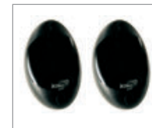
Para fotokomórek zewnętrznych Viky 11