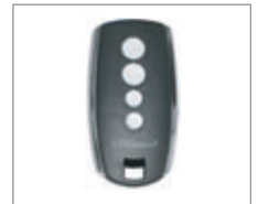
Pilot Kod zmienny - 4 kanały Stylo 4