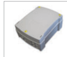
Centrala sterująca z odbiornikiem radiowym Star