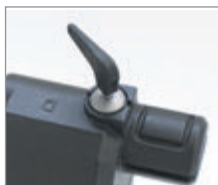
Łatwe i szybkie wysprzęglanie

Linear jest elektromechanicznym napędem dla bram skrzydłowych o maksymalnej długości 5 metrów i wadze 300Kg. Dzięki teleskopowemu ramieniu oraz silnikowi z zabezpieczeniem termicznym 140°C jest bardzo niezawodny. Z Linearem czas instalacji został zredukowany do minimum. Napęd jest dostarczany wraz z przednimi i tylnymi, przykręcanymi wspornikami mocującymi. 1,5m przewód sprawia, że podłączenie prądu jest bardzo łatwe. Mimo utrzymania wysokiego poziomu jakości wykonania, Linear oferuje najtańsze rozwiązanie do automatyzacji bram skrzydłowych. Dostępny jest również w zestawach wraz z akcesoriami sterującymi i sygnalizacyjnymi. W przypadku braku prądu, napęd można łatwo wysprzęglić korzystając z rękojeści podłączanej w górnej części silownika. Plastikowa osłona ochronia wysprzęglik przed oblodzeniem i wodą.